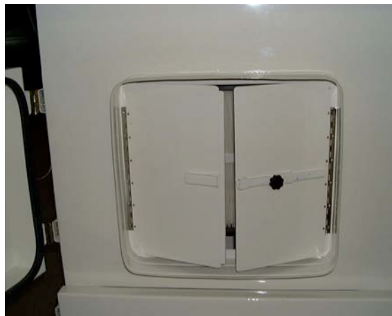
Porte accès cartouches